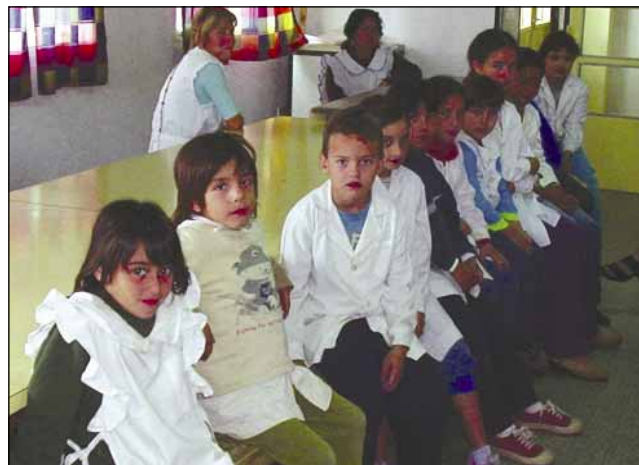
Algunos de los niños y niñas que participaron en el estudio.

Más del 14% de los niños estudiados en Zárate presentaron niveles de plomo en sangre que requirieron algún tipo de seguimiento según las recomendaciones sugeridas por el CDC.